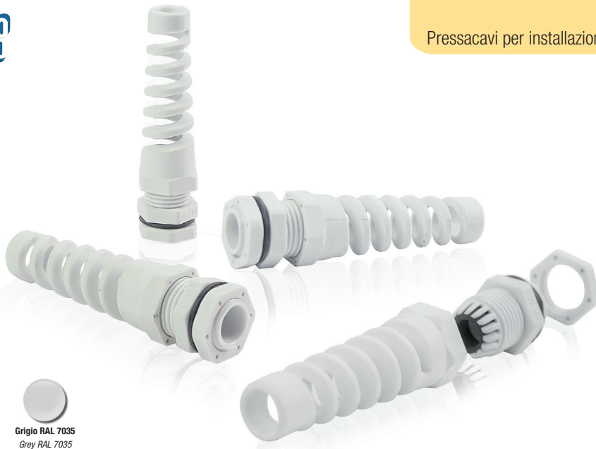
Grigio RAL 7035 Grey RAL 7035